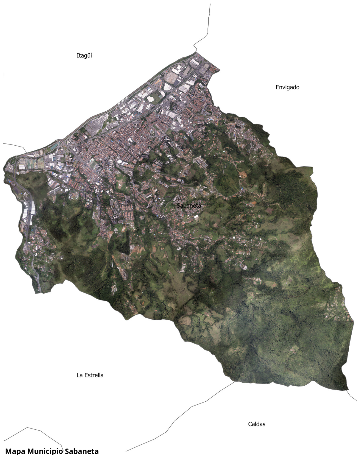
Mapa Municipio Sabaneta

El universo de estudio abarca el Municipio de Sabaneta